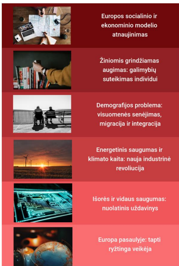
2.2. pav. „Europa 2030“ tikslai

Darnaus ES vystymosi siekiama prisidedant prie projekto „Europa 2030“. Dokumente suformuoti šeši tikslai (žr. 1.2. paveikslą).