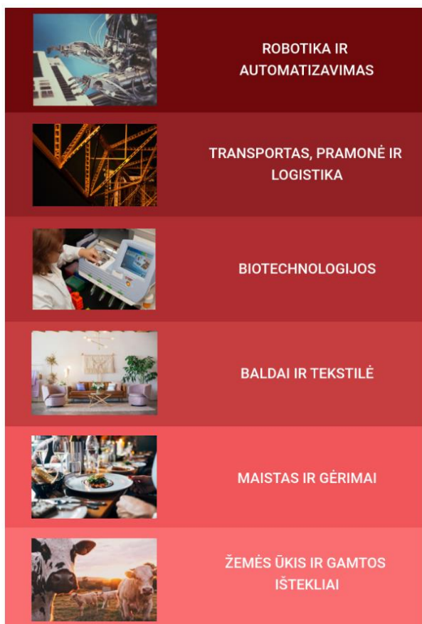
2.7. pav. Panevėžio regiono specializacijos kryptys

Nacionalinės regioninės politikos prioritetų iki 2030 metų projekte pateikiamos Panevėžio regiono plėtros taryboje patvirtintos ir šiuo metu su Lietuvos Respublikos vidaus reikalų ministerija derinamos Panevėžio regiono specializacijos kryptys (žr. 1.7. paveikslą).