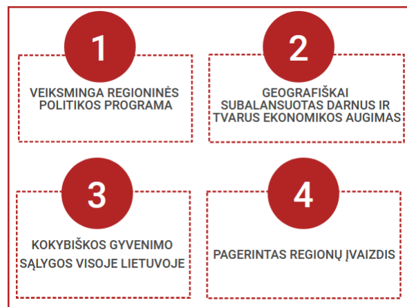
2.6. pav. Nacionalinės regioninės politikos prioritetų iki 2030 m. projektas

Nacionaliniu lygmeniu reikšmingas yra Lietuvos Respublikos regioninės plėtros įstatymas 2 (toliau – Įstatymas), kurio paskirtis – nustatyti nacionalinės regioninės politikos tikslą, jo įgyvendinimo uždavinius, nacionalinės regioninės politikos įgyvendinimą ir finansavimą, teritorijas, kuriose įgyvendinama nacionalinė regioninė politika, regioninės plėtros planavimo dokumentų rengimą ir tvirtinimą, taip pat nacionalinę regioninę politiką įgyvendinančius subjektus ir jų įgaliojimus. Įstatyme nurodomas Nacionalinės regioninės politikos tikslas – mažinti socialinius ir ekonominius skirtumus tarp regionų ir pačiuose regionuose, skatinti visoje valstybės teritorijoje tolygią ir tvarią plėtrą. Vadovaujantis Įstatymo 12 straipsnio 1 punktu, yra parengtas Nacionalinės regioninės politikos prioritetų iki 2030 metų projektas, kuriame suformuoti 4 prioritetai.