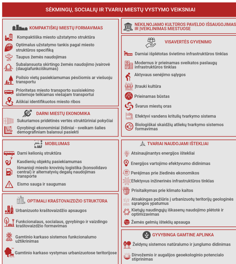
2.8. pav. LRBP įvardinti sėkmingų, socialių ir tvarių miestų vystymo veiksniai

LRBP koncepcijoje su II alternatyva sėkmingų, socialių ir tvarių miestų vystymas yra neatsiejamas nuo šių veiksmų: